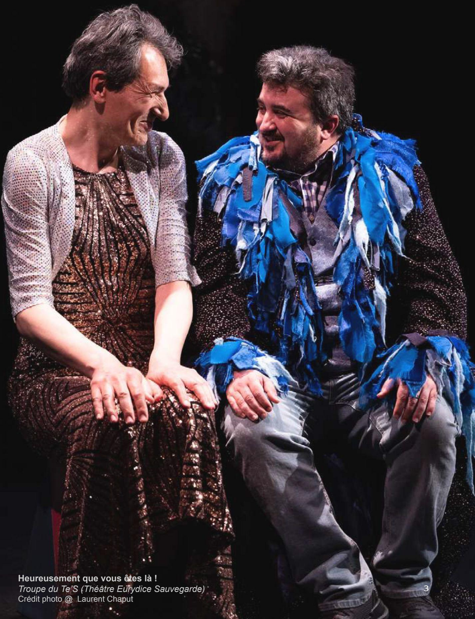
Heureusement que vous êtes là ! Troupe du Te'S (Théâtre Eurydice Sauvegarde)