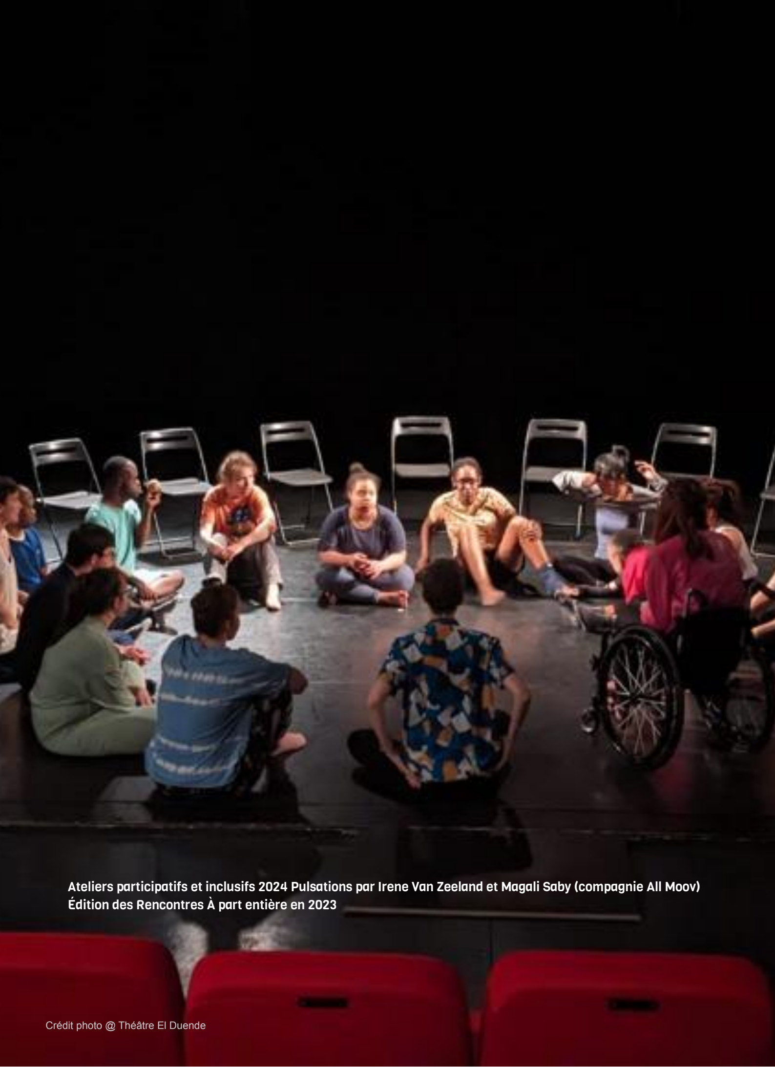
Ateliers participatifs et inclusifs 2024 Pulsations par Irene Van Zeeland et Magali Saby (compagnie All Moov) Édition des Rencontres À part entière en 2023