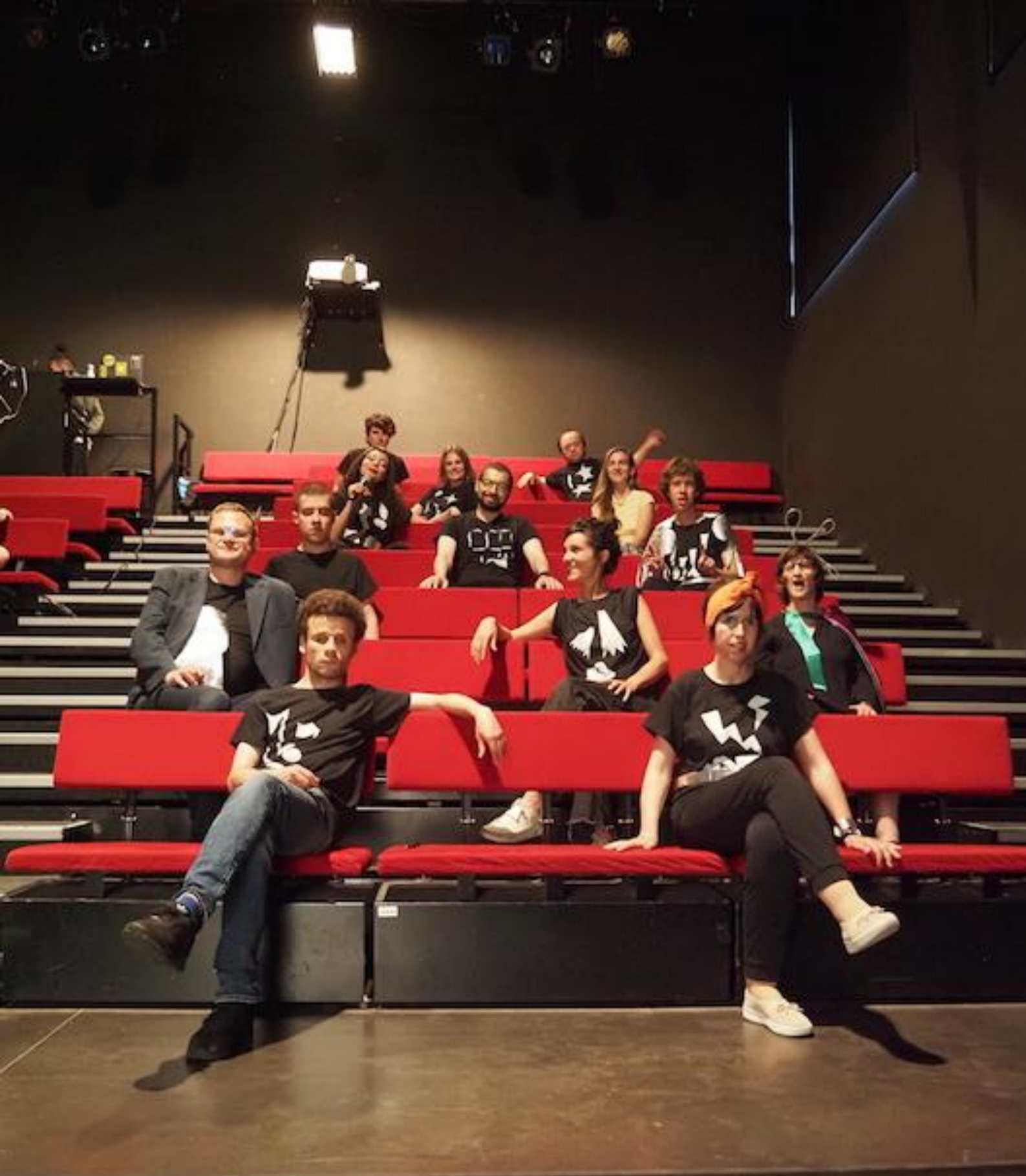
La compagnie Apparente Édition des Rencontres À part entière en 2023